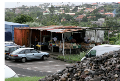
Marché de Godissard avant travaux