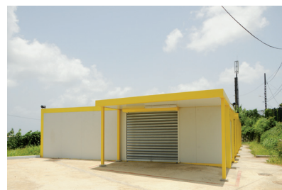
8 à huit - nouvel emplacement

Une opération du PDRU • Un programme en partenariat et cofinancé par