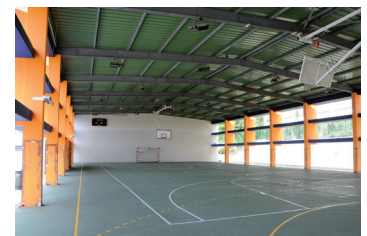
Gymnase Godissard après