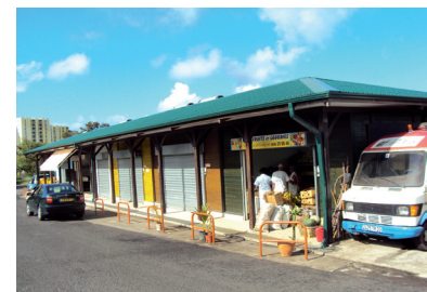
Espace collectif d'insertion par l'économie solidaire