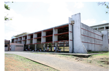
Gymnase Godissard avant