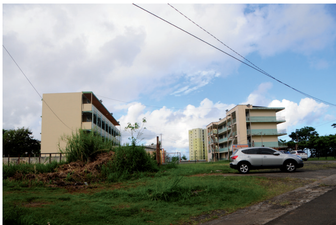
Maternelle de Godissard