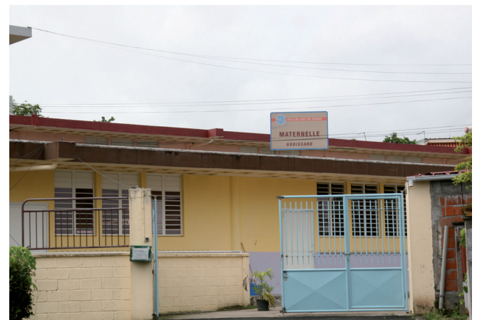
Maternelle de Godissard

Une opération du PDRU • Un programme en partenariat et cofinancé par